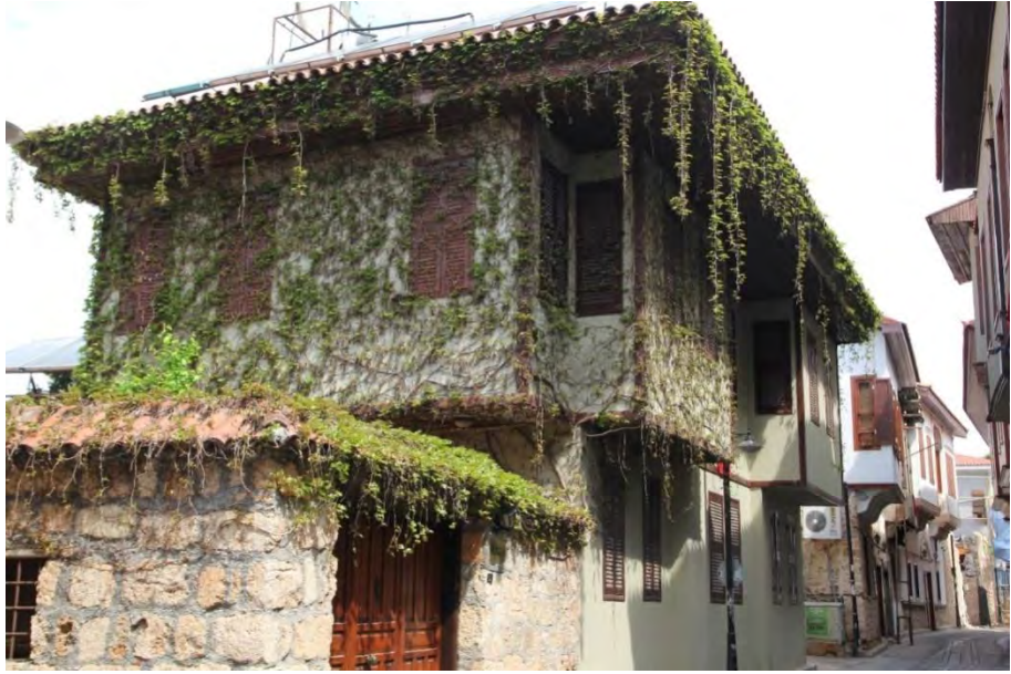
Dar sokakları ve tarihi evleri ile Kaleiçi...

Kaleiçi'nde bulunan birçok tarihi yapı yüzyıllar boyunca badireler yaşamış atlatanlar ayakta durmayı başarmıştır. Birçoğu da payına düşeni almış, zaman içerisinde yıkılmış ayakta durmayı başaramamıştır.