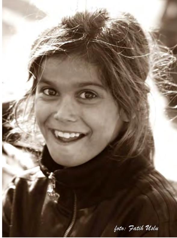
Bir roman kızı...

Kadınlar Kaleiçi'nde gönül rahatlığı ile yürüyemiyor. Bu turizm olamaz. Burada dolaşan herkes bizim misafirimiz. Onlar sayesinde karnımızı doyurabiliyoruz. Netice de Antalya bunun sayesinde ekmek yiyor. Karmaşa hâkim şu anda. Bu durumu nasıl düzeltebiliriz?