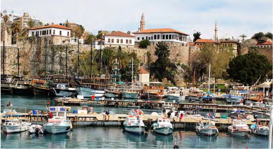
Kaleiçi Yat Limanı – Genel Görünüm

Nitel bir alan araştırması olarak sunulan bu çalışmada derinlemesine mülakat tekniğinden faydalanılmış ve kırka yakın kişi ile mülakatlar gerçekleştirilmiştir. İyi bir literatür taramasının yapıldığı ve arşiv belgelerinden faydalandığı araştırmada özellikle turizm değişkeni olarak belirlenmiş ve turizm öncesi ve sonrası masaya yatırılmıştır.