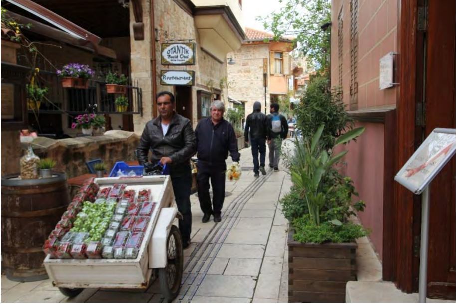
Seyyar satıcılar turfanda meyveleri sunuma hazırlarken...

sanatçıları rahatsız etmezdi. Bu tarz olayların nedeni halkla aktör ve aktrisleri kaynaştırmaktı (T.T.K, E, 33, İşletmeci).