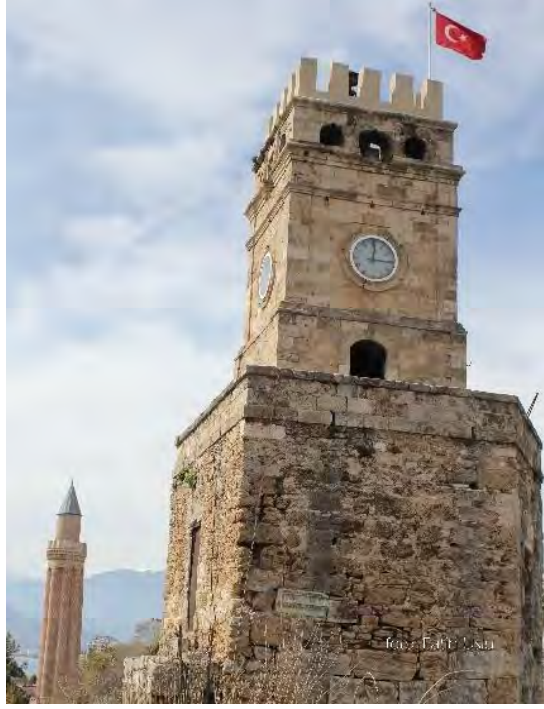
Saat Kulesi ve Yivli Minare Aynı Kadrajda...