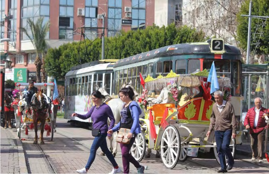
Kültürel Akvaryum Kaleiçi'den bir görünüm...

Benim babam Mübadele Selanik Muhaciri. Biz burada doğduk. Babamın çoğu malı Selanik'te yer alıyordu. Babam Giritliler ile beraber gemilerle geldi. Atatürk zamanında, Selanik'ten gelenlere istediğinizi alın demiş bizimkiler az aldığı için biz fakiriz millet hep zengin. Babam göçmen değil (A.A. H.,70, K).