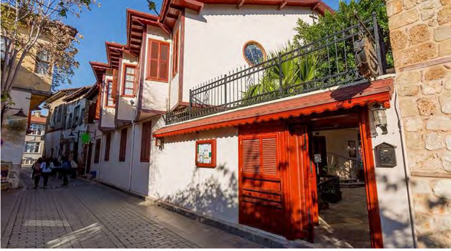
Sanat tarihçiler ve mimarların ilgi odağı Kaleiçi...