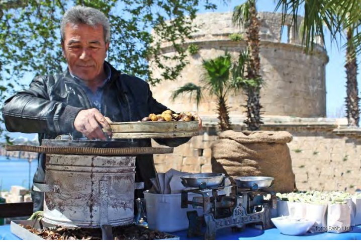
Memleketi Sivas'tan gelerek Kaleiçi'nde seyyar satıcılık yapan bir esnaf...

Hıdırlık kulesi içerisine şu anda giriş yoktur. Hıdırlık Kulesi'nin doğu tarafında Karaalioğlu Parkı yer almaktadır. Bu bölüm Kaleiçi dışında yer alan en kalabalık sosyal alanlardan biri olduğu için bu alan neredeyse hiç boş kalmamaktadır. Yakın zamanda bu kule çevresine açılan kafe ve restoranlar ile kalabalık bir hayli artmıştır.