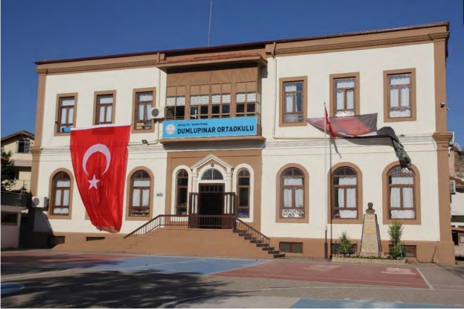
Dumlupınar İlkokulu'ndan bir görünüm / Kaleiçi-2018