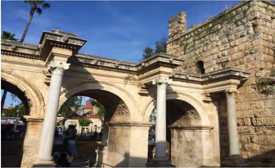
(Üç Kapılar) Hadrian Kapısı