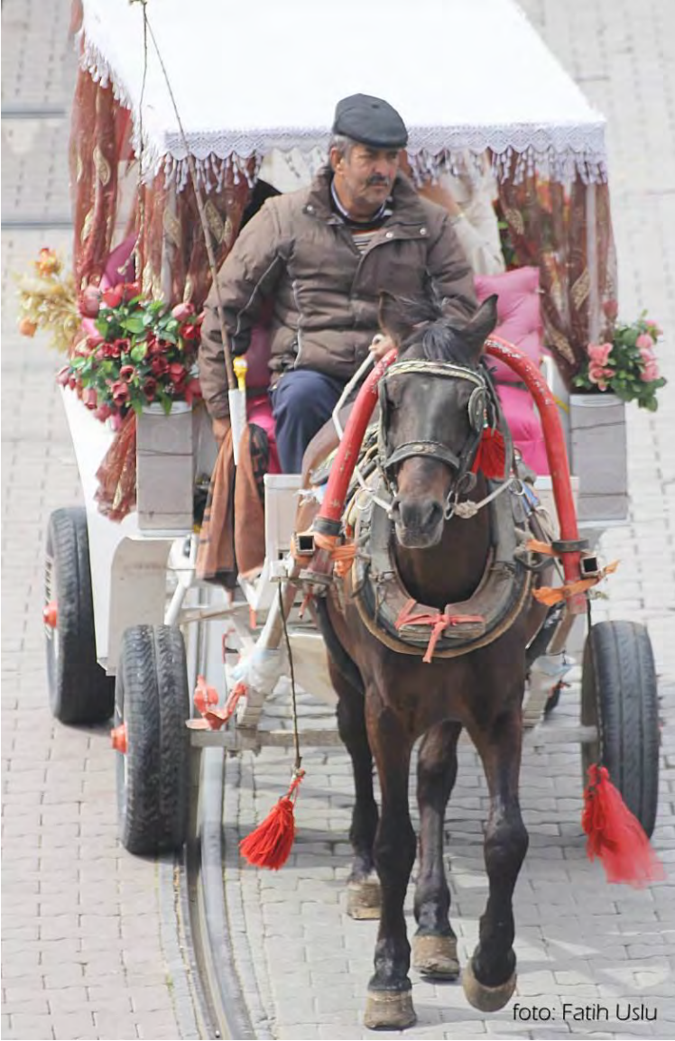
Kaleiçi'nin sembollerinden at arabası...

Bizim sektörümüzde buralarda hep butik otel olduğu için gelen misafir portföyü farklı. Genellikle kültür turizmi için gelen insanlar. Biraz daha bilinçli biraz daha ne istediğini ne aradığını nereye gitmek istediğini bilen insanlar geliyor. Şu anda bu bile değişmeye başladı. Dolayısıyla sadece bize gelmiyor. Bizde kalıyor 3 gün bizden sonra Kapadokya'ya gidiyor tarihi yerleri geziyor. Genellikle bizim misafirlerimiz Amerikalılar ve İngilizlerdir. Grup olarak gelirler. Ama artık Amerikalılar hiç gelmiyor ülkenin durumundan dolayı. Şu anda