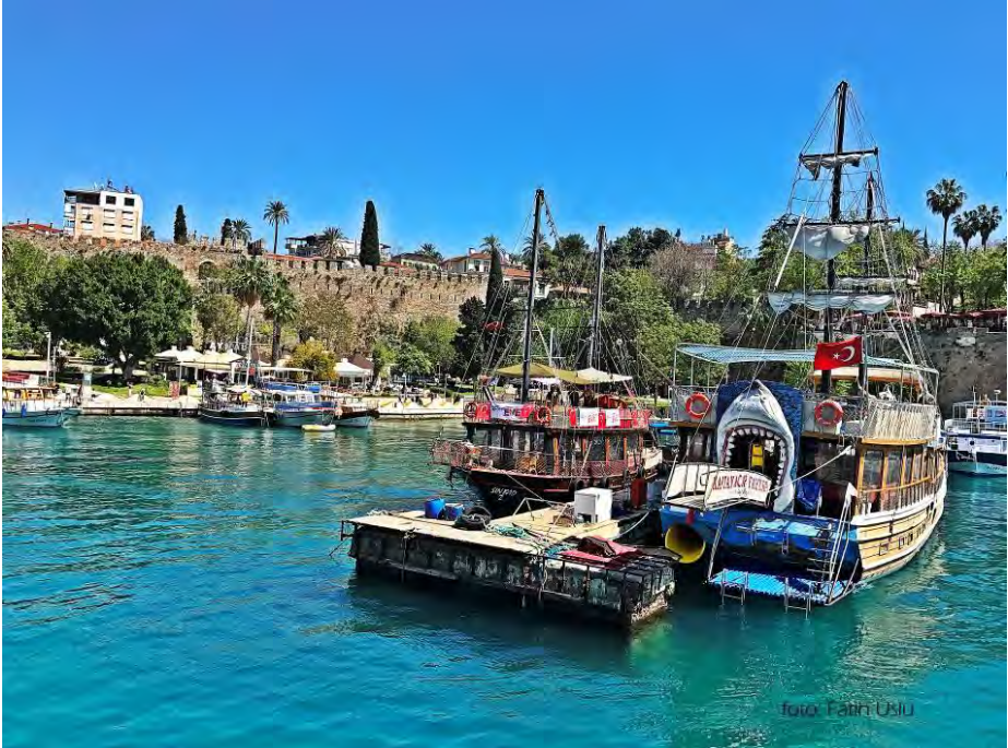
Bir zamanlar Maunaların yüklendiği yat limanı artık turistleri gezdiren yatlarla dolu...

1960' lı yılların sonuna gelindiğinde ahşap yapı geleneği yerini beton yapılara bırakmış bu da Kaleiçi'ndeki yapıların önemsenmemesine bakım onarımının yapılmamasına neden olmuştur. 12 km doğuya yeni ticaret limanının yapılmasıyla da eski yat limanı önemini kaybetmeye başlamış ve buralar terk edilerek doğanın yıkımıyla baş başa bırakılmışlardır.