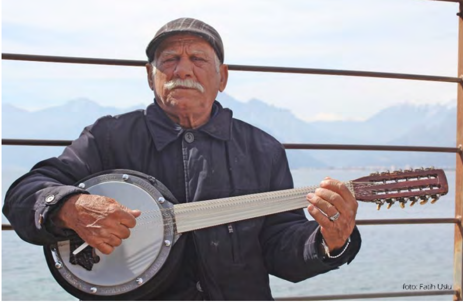
Kaleiçi'ne hareket katan sokak müzisyenlerinden bir görüntü...

e) Kaleiçi'nde gidilecek nadir mekânlardan biridir. İçerisi oldukça küçük olmasına rağmen. Canlı müzik grupları sayesinde oldukça eğlenceli bir mekândır.