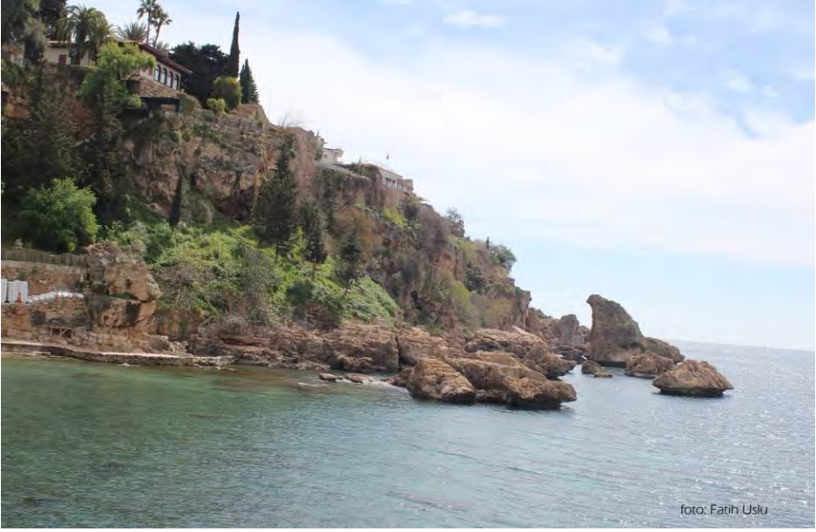
Mermerli plajından bir görünüm...