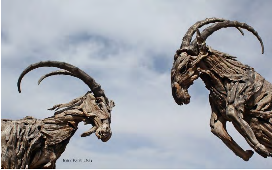
Kaleiçi'nin sembollerinden Ağaçtan yapılmış Dağ Keçisi Heykelleri

Araştırmada, yöntem olarak Nitel Araştırma Yöntemi benimsenmiş olup, gözlem tekniğinden faydalanılmıştır. Nitel yöntemeye uygun bir veri toplama tekniği olan yüz yüze görüşme, odak grup görüşmesi bu araştırmanın uygulamasında kullanılmıştır. Yarı yapılandırılmış görüşme tekniğinin benimsenmesi, esasen burada yazılı çok fazla bilgi olmaması ve var olan yerleşimin yakın tarihte sayılabilecek insanlar tarafından biliniyor olması, sözlü kültürün önemine de vurgu yapmaktadır.