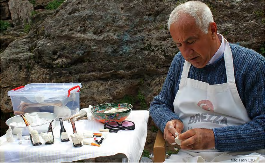
Lüle taşı oymacılığı ile geçimini sağlayan bir esnaf...

azalmıştır. Rumların terk ettiği topraklara ve evlerin bir bölümüne Antalya'nın ileri gelenleri yerleşirken diğer bölümlerine ise Yunanistan'dan gelen mübadiller yerleştirilmişlerdir. Toprakla uğraşan ve kırsal kesim dengelenler Değirmenönü Caddesi üzerindeki evlere, Selanik ve Kesriye'nin kent yaşamından gelenler ise Antalya Kaleiçi ile Kale dışındaki Balbey, Elmalı, Yenikapı gibi semtlere yerleştirilmişlerdir (Çimrin, 2007).