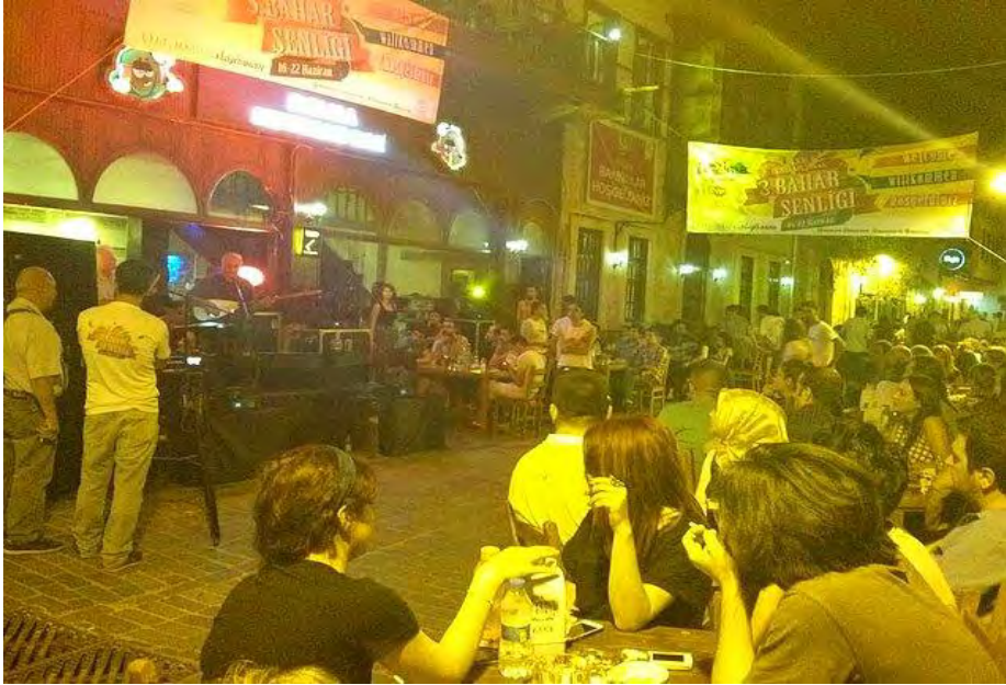
Kaleiçi'nde gece eğlencelerinden bir görüntü...

c) Burası son 1 yılda duyulmuş kendine özgü özel bir meyhanedir. Fotoğraf meyhanenin en önemli özelliğini anlatmaktadır. Burada çok uygun bir ücrete sınırsız hamsi yiyebilirsiniz. Harbiden sınırsız ama. Yani bittikçe geliyor masanıza. Mezeleri de fena değildir. İçeride farklı gelir gruplarından insanlar vardır. Çoğunlukla ya hep zengin mekanlarda takılıyor biraz da salaş takılalım diyen sosyetenin ünlü simalarına rastlayabilirsiniz. Ama öğrenci olarak da gidebileceğiniz, müziği fena olmayan iyi bir meyhanedir.