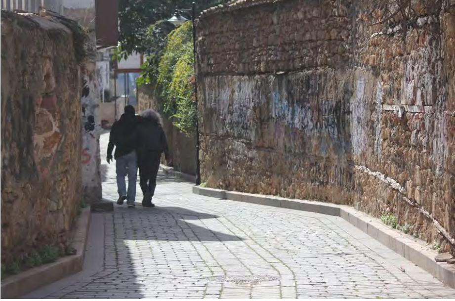
Âşıkların buluştuğu mistik mekânlardan biridir Kaleiçi...

Kaleiçi'nin turizm potansiyelini başta orta yaş ve üzeri Almanlar, genç orta yaş Rus turistler ve yerli turistler oluşturmaktadır. Bu durum bölgede bulunan dükkanların da ekonomisine etki etmektedir. Belli dönemlerde gelen turistler Kaleiçi'ndeki alışveriş tercihlere belirli alanlara yönelik oluyor. Bu durum bazı esnaflar için iyiyken bazıları için de sıkıntılar oluşturmaktadır