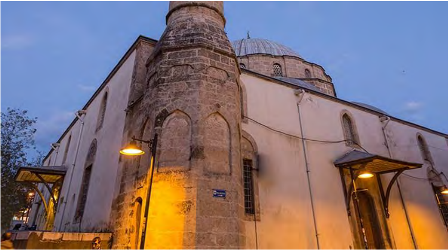
Yakın geçmişe kadar önemli cenazelerin kaldırıldığı tarihi Tekeli Mehmet Paşa Camii...