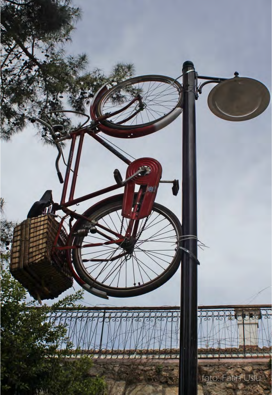
Kaleiçi'nden fantastik bir görünüm...