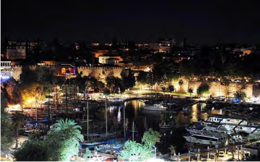
Kaleiçi, gece görünümü...

Turizmin başkenti Antalya'nın onlarca bar ve kafenin olduğu tarihi Kaleiçi, aynı zamanda kentin en önemli eğlence merkezi konumunda. Yat Limanı ile bütünleşik olarak yerli ve yabancı turistlerin en güzide mekânı olan tarihi Kaleiçi'nde, butik pansiyonların yanı sıra kafe-bar tarzında 100'e yakın eğlence mekânı da bulunuyor. Yapıların büyük buluşma bahçeli olan veya sigara yasağı gibi nedenlerle de birçoğunun dışarıya masa-sandalye attığı işletmelere yönelik son günlerde sıkı denetim uygulanmaya başladı.