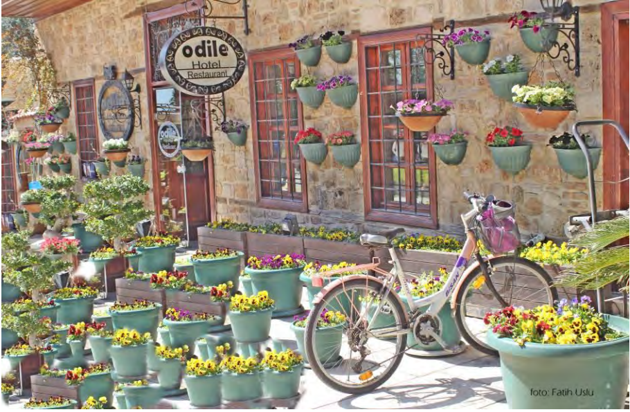
Kaleiçi'ndeki güzelliklerden bir kare...

Günümüzde, Kaleiçi'nin konut dokusunun yoğun olduğu bölge de turistik ve kültürel amaçlara hizmet eden yapılar her geçen gün artmaktadır. Birçok sivil mimarlık örneği yapı, otel, müze veya kafeye dönüştürülmüş ya da dönüştürülmektedir. İşlev değişikliği yaşayan bu yapıların, yeni işlevine uyumları çoğunlukla başarılı olmakla birlikte başarısız uygulamalar da vardır. Önemli olan Kaleiçi'nin özgün yapısının korunmasıdır.