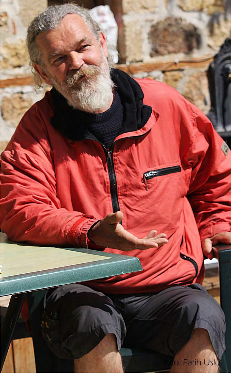
La Polama Hotel müdavimlerinden...

Kaleiçi ile ilgili yukarda bahsettiğimiz fiziksel iyileştirme çabalarının dışında kültürel ve sosyolojik iyileştirme çabalarının da gerekliliği göz ardı edilmemelidir. Eski esnaflık ilişkileri komşuluk ilişkileri sağlanmalı insanla-