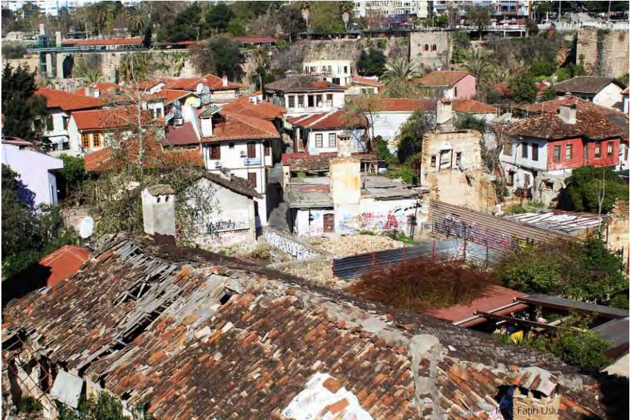
Kaleiçi merkezinde bir çatıdan çekilmiş güncel bir fotoğraf...

Benim babam Mübadele Selanik Muhaciri. Biz burada doğduk. Babamın çoğu malı Selanik'te yer alıyordu. Babam Giritliler ile beraber gemilerle geldi. Atatürk zamanında, Selanik'ten gelenlere istediğinizi alın demiş bizimkiler az aldığı için biz fakiriz millet hep zengin. Babam göçmen değil (A.H., 79, K, Ev hanımı).