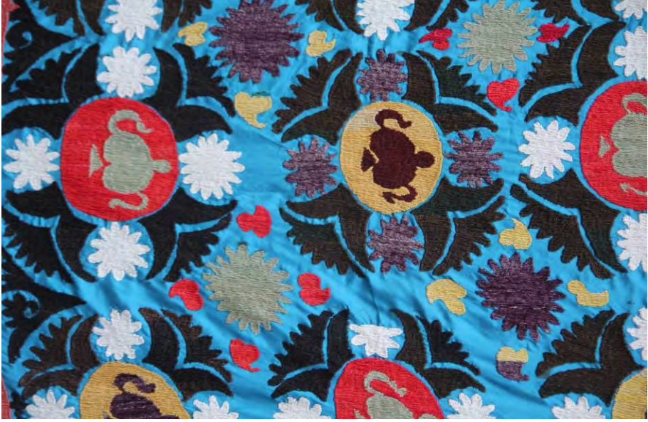
Kültürel Akvaryum Kaleiçi'nden bir kare; Afgan Şalı

çevreler. Geniş basık yay kemerli kapının üst kısmında 6 satır halinde düzenlenmiş kitabe taşı bulunmaktadır.