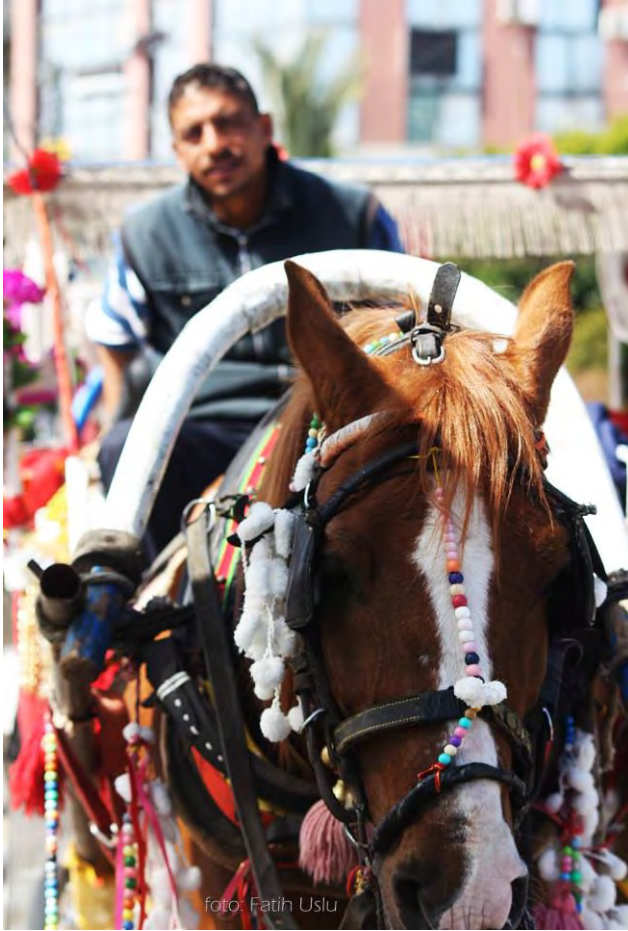
Kaleiçi'nin olmazsa olmazı faytonlar...

• Yeniden gelişim-yönelimli liberal politika-ekonomisi, endüstri sonrası şehirler planlama amaçlı kentsel yeniden canlandırma yaklaşımı (1960-1980 Dönemi).