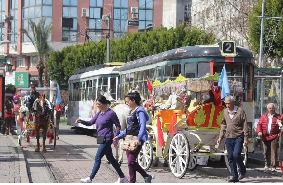
Kültürel Akvaryum Kaleiçi'den bir görünüm...

Benim babam Mübadele Selanik Muhaciri. Biz burada doğduk. Babamın çoğu malı Selanik'te yer alıyordu. Babam Giritliler ile beraber gemilerle geldi. Atatürk zamanında, Selanik'ten gelenlere istediğinizi alın demiş bizimkiler az aldığı için biz fakiriz millet hep zengin. Babam göçmen değil (A.A. H.,70, K).