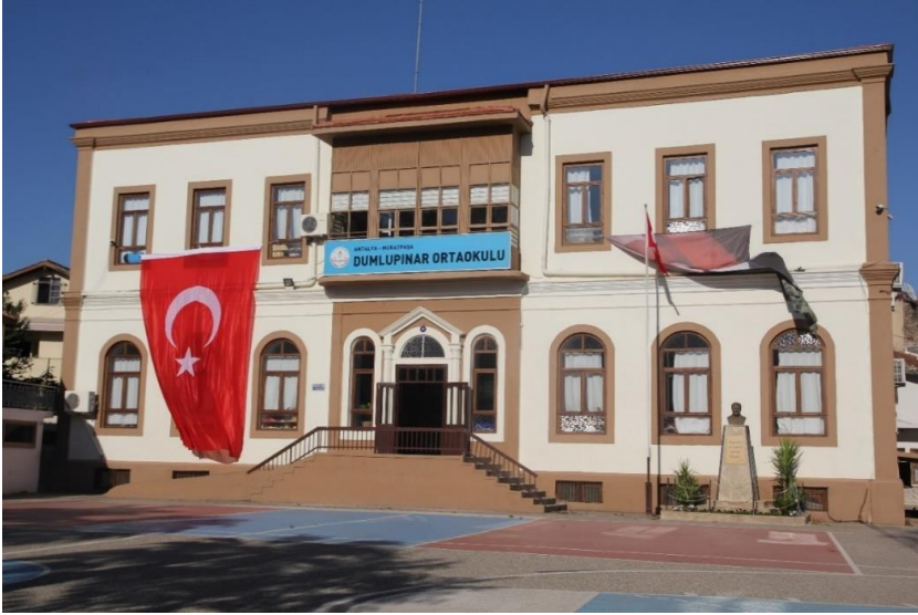
Dumlupınar İlkokulu'ndan bir görünüm / Kaleiçi-2018

Kaleiçi'nde turistlerle nasıl davranılacağına dair bir kurs verilseydi çok güzel olurdu. İnsanımız turistlerle iletişimini geliştirmeli çoğunlukla turistlerin gelmemesindeki asıl neden iletişim sıkıntısıdır. 30 saatlik bir karşılama uğurlama dersleri verilseydi çok hoş olurdu. Böylece turistler aldıkları hizmetten daha fazla hoşnut kalırlardı. Ancak bu şekilde buraya gelen turist sayısında bir artış olabilir. Burada her şey akışına bırakıldı ve bu da çok yanlışlara sebep oldu. Eskiden oteller doluydu, terasta bile misafir ağırladık o derecede bir yığılma yaşanırdu, turistleri ağırlayacak yerimiz kalmazdı. Fakat bugünlerde odalarımız boş kalıyor bu da biz üzüyor. Turistler gelince elimizden gelen en iyi misafirperverliği yapar ve boş göndermeyiz, asla bizi kötü hatırlamalarını istemeyiz onları çok güzel bir şekilde karşılayarak en iyi hizmeti sunmaya gayret eder ve aynı şekilde onları uğurlarız (A. Y., E, 45).