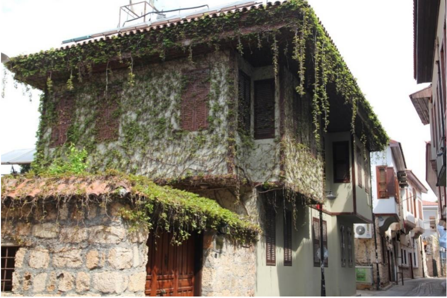
Dar sokakları ve tarihi evleri ile Kaleiçi...

Kaleiçi'nde bulunan birçok tarihi yapı yüzyıllar boyunca badireler yaşamış atlatanlar ayakta durmayı başarmıştır. Birçoğu da payına düşeni almış, zaman içerisinde yıkılmış ayakta durmayı başaramamıştır.