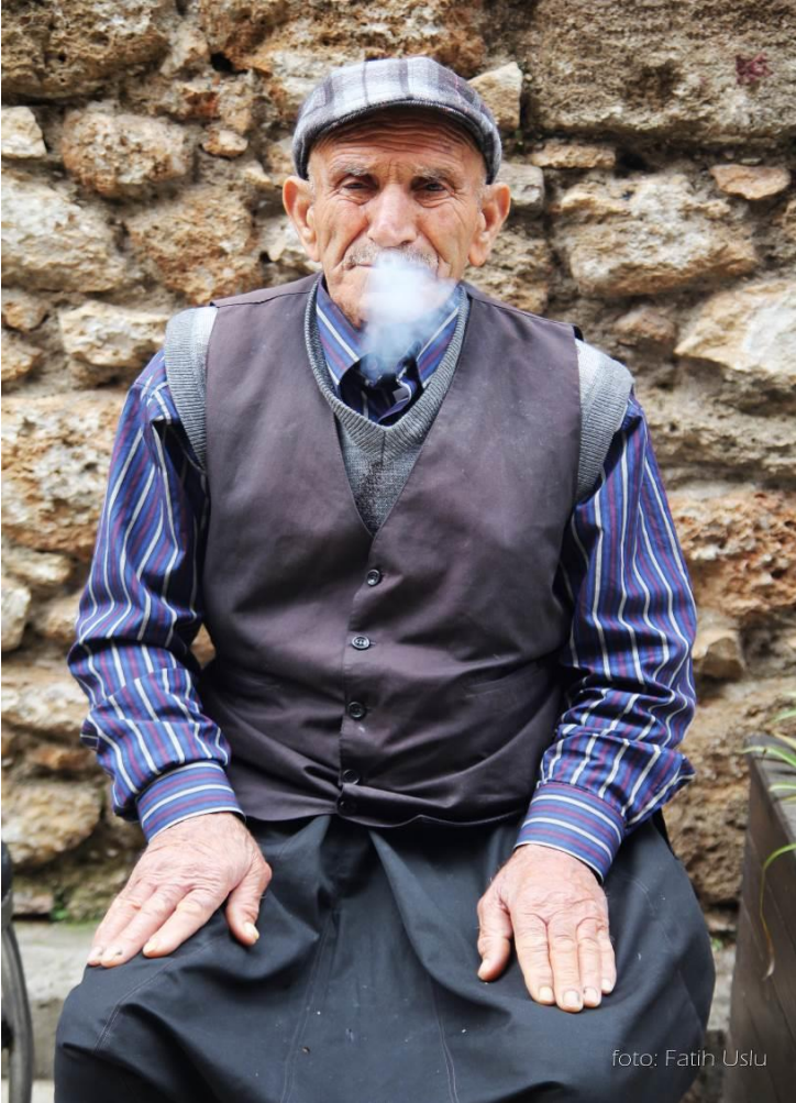
Uzak diyarlardan Kaleiçi'ne gelip esnaflık yapan bir amca...