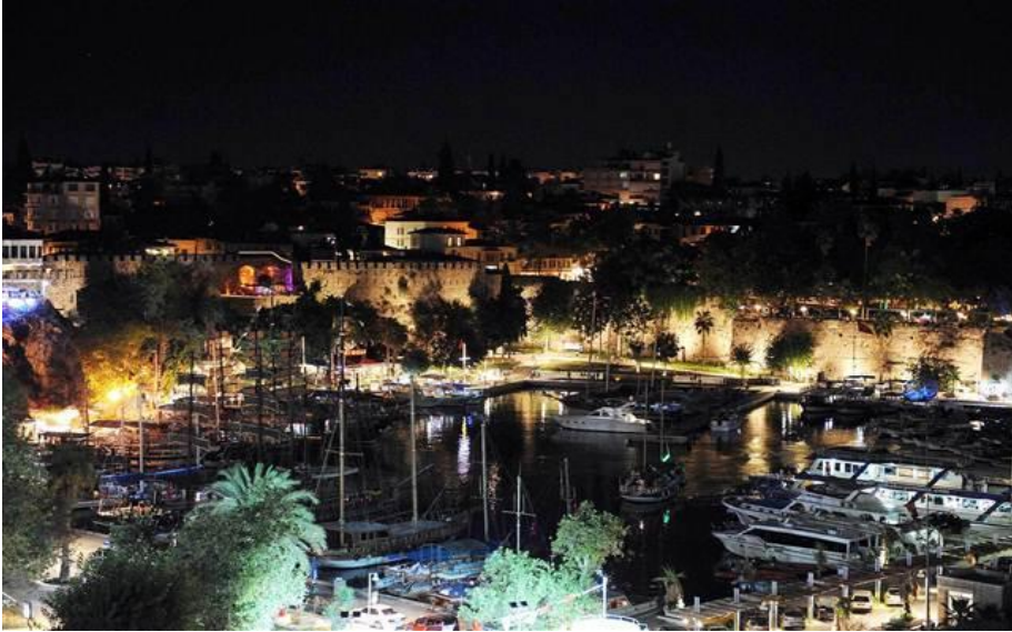
Kaleiçi, gece görünümü...

Turizmin başkenti Antalya'nın onlarca bar ve kafenin olduğu tarihi Kaleiçi, aynı zamanda kentin en önemli eğlence merkezi konumunda. Yat Limanı ile bütünleşik olarak yerli ve yabancı turistlerin en güzide mekânı olan tarihi Kaleiçi'nde, butik pansiyonların yanı sıra kafe-bar tarzında 100'e yakın eğlence mekânı da bulunuyor. Yapıların büyük buluşma bahçeli olan veya sigara yasağı gibi nedenlerle de birçoğunun dışarıya masa- sandalye attığı işletmelere yönelik son günlerde sıkı denetim uygulanmaya başladı.