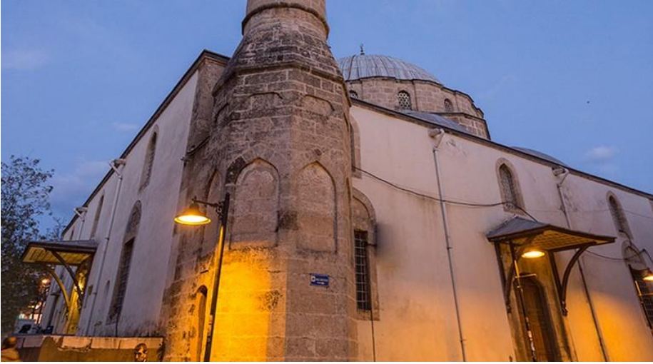
Yakın geçmişe kadar önemli cenazelerin kaldırıldığı tarihi Tekeli Mehmet Paşa Camii...