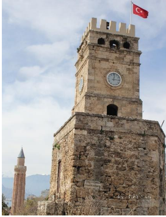
Saat Kulesi ve Yivli Minare Aynı Kadrajda...