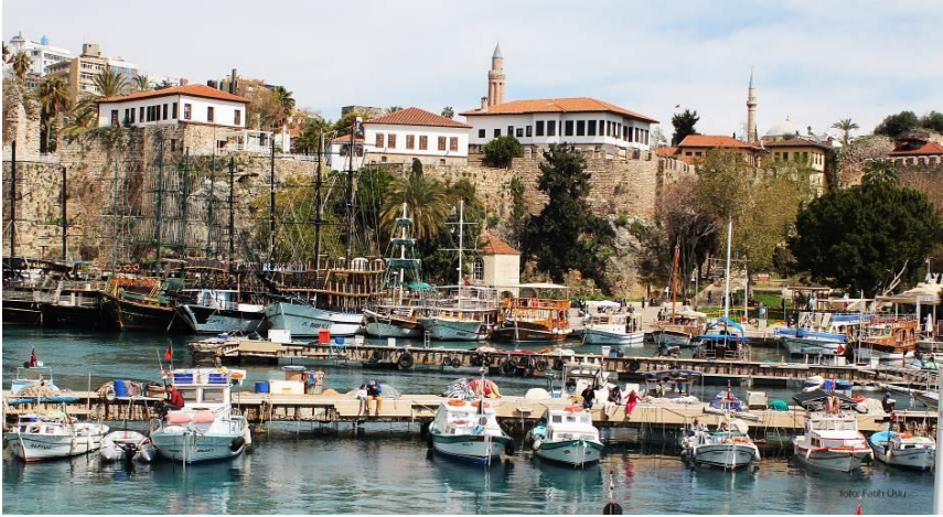
Kaleiçi Yat Limanı – Genel Görünüm

Nitel bir alan araştırması olarak sunulan bu çalışmada derinlemesine mülakat tekniğinden faydalanılmış ve kırka yakın kişi ile mülakatlar gerçekleştirilmiştir. İyi bir literatür taramasının yapıldığı ve arşiv belgelerinden faydalandığı araştırmada özellikle turizm değişkeni olarak belirlenmiş ve turizm öncesi ve sonrası masaya yatırılmıştır.