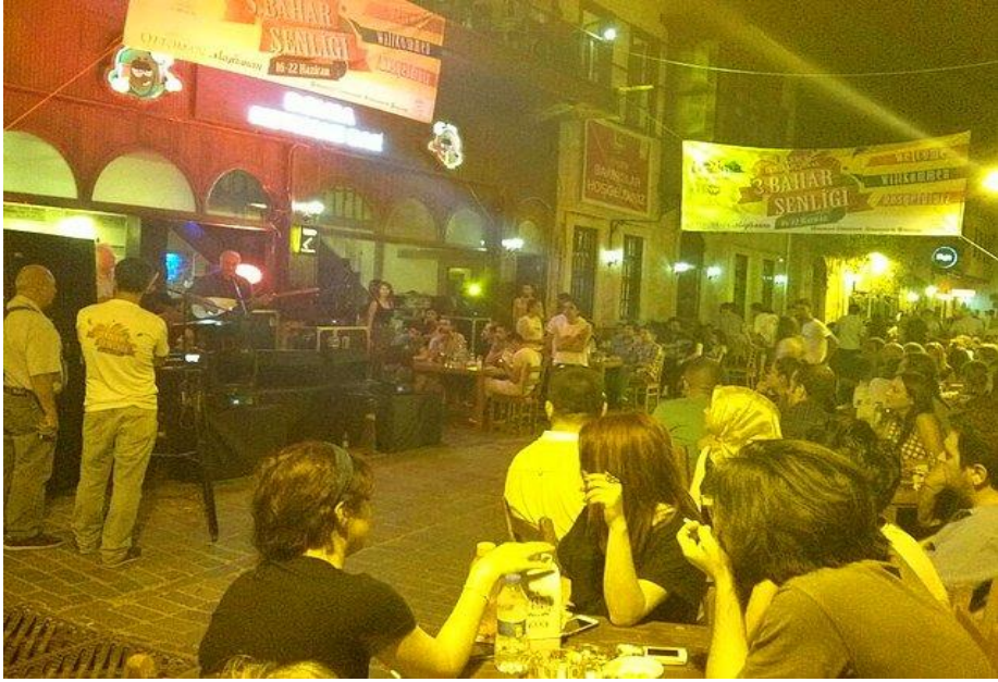
Kaleiçi'nde gece eğlencelerinden bir görüntü...

c) Burası son 1 yılda duyulmuş kendine özgü özel bir meyhanedir. Fotoğraf meyhanenin en önemli özelliğini anlatmaktadır. Burada çok uygun bir ücrete sınırsız hamsi yiyebilirsiniz. Harbiden sınırsız ama. Yani bittikçe geliyor masanıza. Mezeleri de fena değildir. İçeride farklı gelir gruplarından insanlar vardır. Çoğunlukla ya hep zengin mekanlarda takılıyor biraz da salaş takılalım diyen sosyetenin ünlü simalarına rastlayabilirsiniz. Ama öğrenci olarak da gidebileceğiniz, müziği fena olmayan iyi bir meyhanedir.