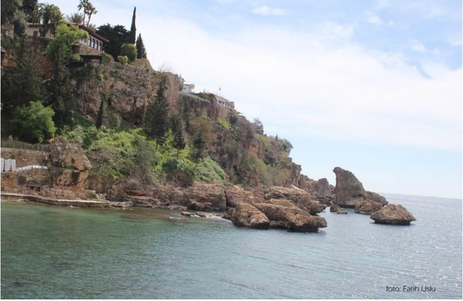
Mermerli plajından bir görünüm...