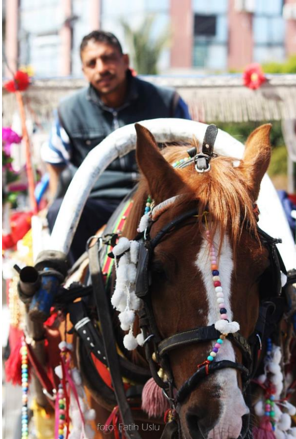
Kaleiçi'nin olmazsa olmazı faytonlar...

• Yeniden gelişim-yönelimli liberal politika-ekonomisi, endüstri sonrası şehirler planlama amaçlı kentsel yeniden canlandırma yaklaşımı (1960-1980 Dönemi).