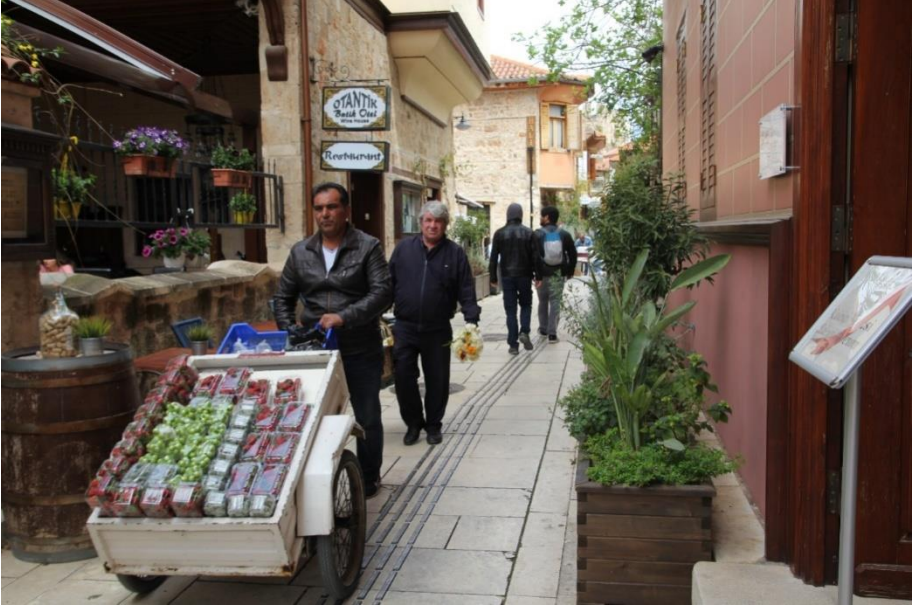
Seyyar satıcılar turfanda meyveleri sunuma hazırlarken...