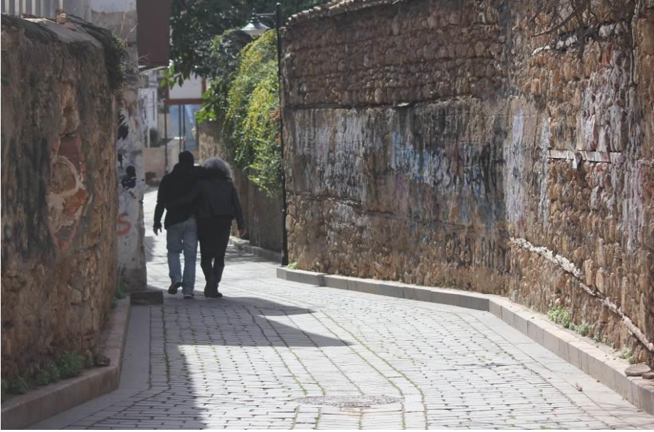
Âşıkların buluştuğu mistik mekânlardan biridir Kaleiçi...

Kaleiçi'nin turizm potansiyelini başta orta yaş ve üzeri Almanlar, genç orta yaş Rus turistler ve yerli turistler oluşturmaktadır. Bu durum bölgede bulunan dükkanların da ekonomisine etki etmektedir. Belli dönemlerde gelen turistler Kaleiçi'ndeki alışveriş tercihlerine belirli alanlara yönelik oluyor. Bu durum bazı esnaflar için iyiyken bazıları için de sıkıntılar oluşturmaktadır