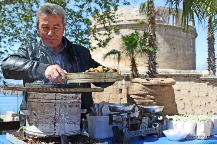
Memleketi Sivas'tan gelerek Kaleiçi'nde seyyar satıcılık yapan bir esnaf...

Hıdırlık kulesi içerisine şu anda giriş yoktur. Hıdırlık Kulesi'nin doğu tarafında Karaalioğlu Parkı yer almaktadır. Bu bölüm Kaleiçi dışında yer alan en kalabalık sosyal alanlardan biri olduğu için bu alan neredeyse hiç boş kalmamaktadır. Yakın zamanda bu kule çevresine açılan kafe ve restoranlar ile kalabalık bir hayli artmıştır.