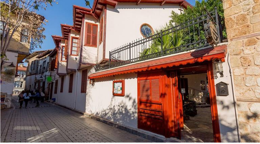
Sanat tarihçiler ve mimarların ilgi odağı Kaleiçi...