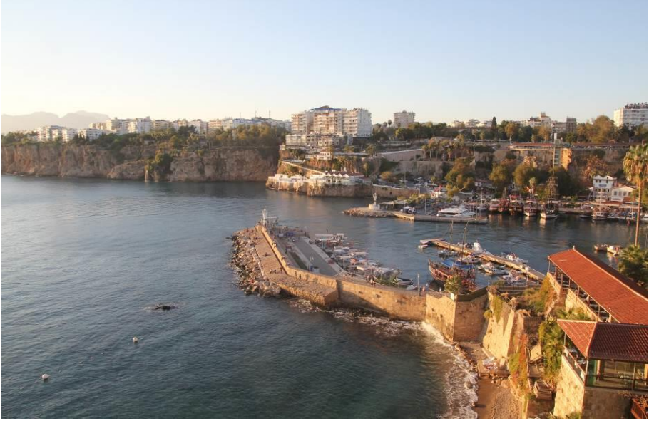
Kaleiçi’nde Mermerli plajından kuzeydoğusundaki yangında yanan değirmen yerine yapılmış asansöre uzanan bir görüntü...

gem, kolan türlü gereksinimler için kullanılan tulumlar vb. birçok şey deriden yapılırdı. Deri hala tabi ki günümüzde önemini sürdürmekte çoğu şey satılırken hakiki ve el işçiliği olması o ürünün önemini artıran unsurlardan birisidir. Ahilik kültürü kapsamında turistlere yönelik çarşı ve pazarda herhangi bir olumsuzluğun yaşanmaması için 1931’de yerli mallara özgü bir serginin açılmasına karar verildi. Burada satılan eşyaya sabit ve gerçek fiyatlar koydurularak turistlerin aldatılmamaları sağlanacaktı (Dağlı, 2021: 431).