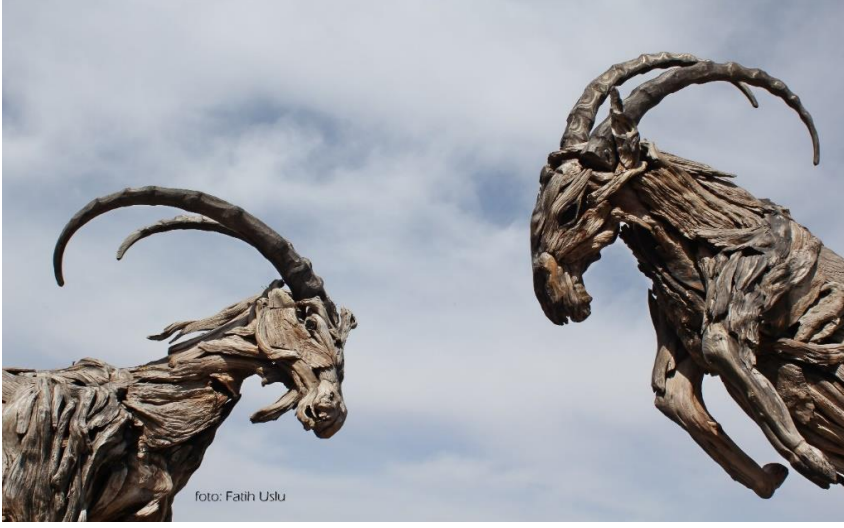
Kaleiçi'nin sembollerinden Ağaçtan yapılmış Dağ Keçisi Heykelleri

Araştırmada, yöntem olarak Nitel Araştırma Yöntemi benimsenmiş olup, gözlem tekniğinden faydalanılmıştır. Nitel yöntemeye uygun bir veri toplama tekniği olan yüz yüze görüşme, odak grup görüşmesi bu araştırmanın uygulamasında kullanılmıştır. Yarı yapılandırılmış görüşme tekniğinin benimsenmesi, esasen burada yazılı çok fazla bilgi olmaması ve var olan yerleşimin yakın tarihte sayılabilecek insanlar tarafından biliniyor olması, sözlü kültürün önemine de vurgu yapmaktadır.