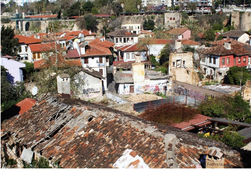
Kaleiçi merkezinde bir çatıdan çekilmiş güncel bir fotoğraf...

Benim babam Mübadele Selanik Muhaciri. Biz burada doğduk. Babamın çoğu malı Selanik'te yer alıyordu. Babam Giritliler ile beraber gemilerle geldi. Atatürk zamanında, Selanik'ten gelenlere istediğinizi alın demiş bizimkiler az aldığı için biz fakiriz millet hep zengin. Babam göçmen değil (A.H., 79, K, Ev hanımı).