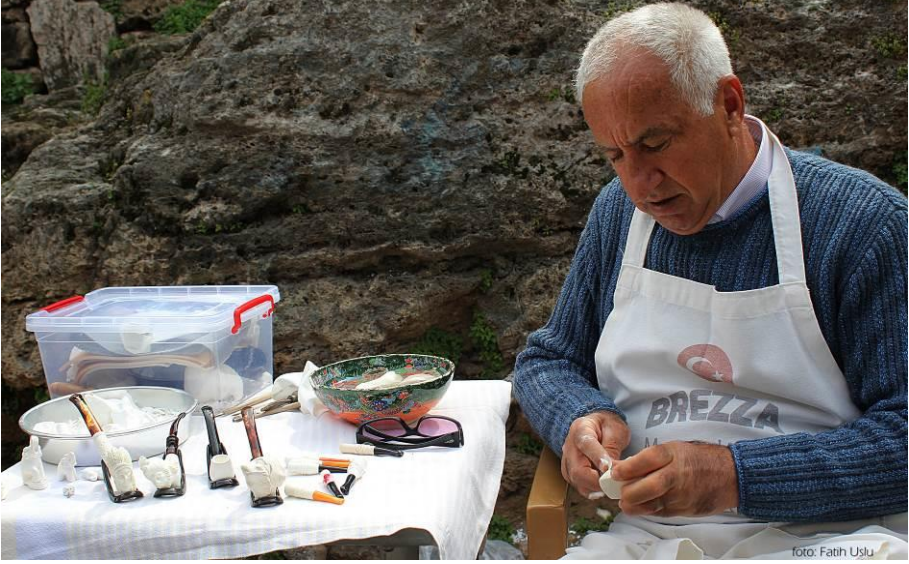
Lüle taşı oymacılığı ile geçimini sağlayan bir esnaf...

azalmıştır. Rumların terk ettiği topraklara ve evlerin bir bölümüne Antalya'nın ileri gelenleri yerleşirken diğer bölümlerine ise Yunanistan'dan gelen mübadiller yerleştirilmişlerdir. Toprakla uğraşan ve kırsal kesim dengelenler Değirmenönü Caddesi üzerindeki evlere, Selanik ve Kesriye'nin kent yaşamından gelenler ise Antalya Kaleiçi ile Kale dışındaki Balbey, Elmalı, Yenikapı gibi semtlere yerleştirilmişlerdir (Çimrin, 2007).