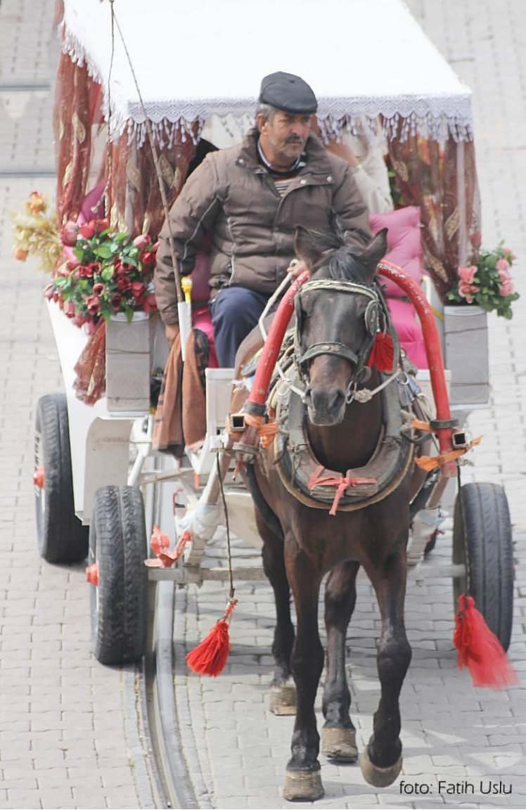
Kaleiçi'nin sembollerinden at arabası...

Bizim sektörümüzde buralarda hep butik otel olduğu için gelen misafir portföyü farklı. Genellikle kültür turizmi için gelen insanlar. Biraz daha bilinçli biraz daha ne istediğini ne aradığını nereye gitmek istediğini bilen insanlar geliyor. Şu anda bu bile değişmeye başladı. Dolayısıyla sadece bize gelmiyor. Bizde kalıyor 3 gün bizden sonra Kapadokya'ya gidiyor tarihi yerleri geziyor. Genellikle bizim misafirlerimiz Amerikalılar ve İngilizlerdir. Grup olarak gelirler. Ama artık Amerikalılar hiç gelmiyor ülkenin durumundan dolayı. Şu anda