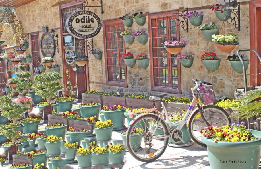
Kaleiçi'ndeki güzelliklerden bir kare...

Günümüzde, Kaleiçi'nin konut dokusunun yoğun olduğu bölge de turistik ve kültürel amaçlara hizmet eden yapılar her geçen gün artmaktadır. Birçok sivil mimarlık örneği yapı, otel, müze veya kafeye dönüştürülmüş ya da dönüştürülmektedir. İşlev değişikliği yaşayan bu yapıların, yeni işlevine uyumları çoğunlukla başarılı olmakla birlikte başarısız uygulamalar da vardır. Önemli olan Kaleiçi'nin özgün yapısının korunmasıdır.